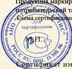
Схема сертификации №3

Продукция маркируется знаком соответствия по ГОСТ Р 50460-92 на корпусе изделия, потребительской таре и (или) в сопроводительной технической документации.